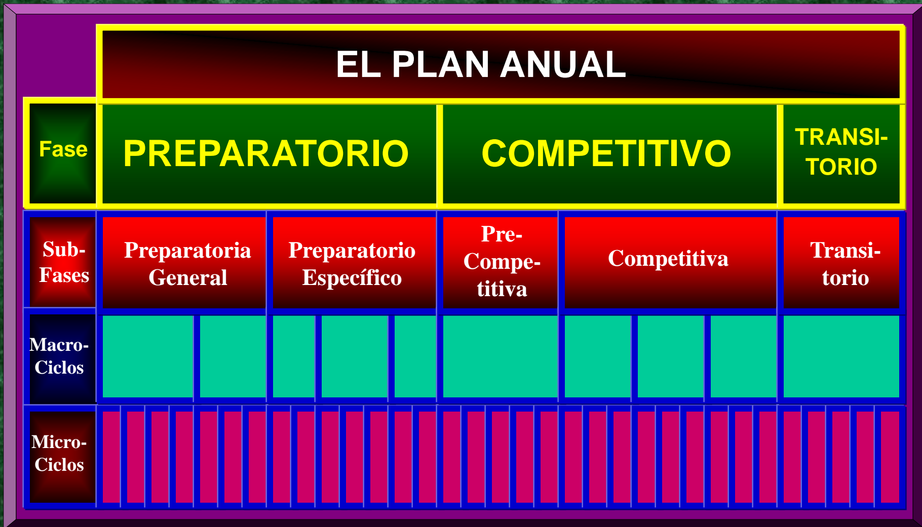
Ilustración Esquemática de la División de un Plan Anual en sus Fases y Ciclos de Entrenamiento