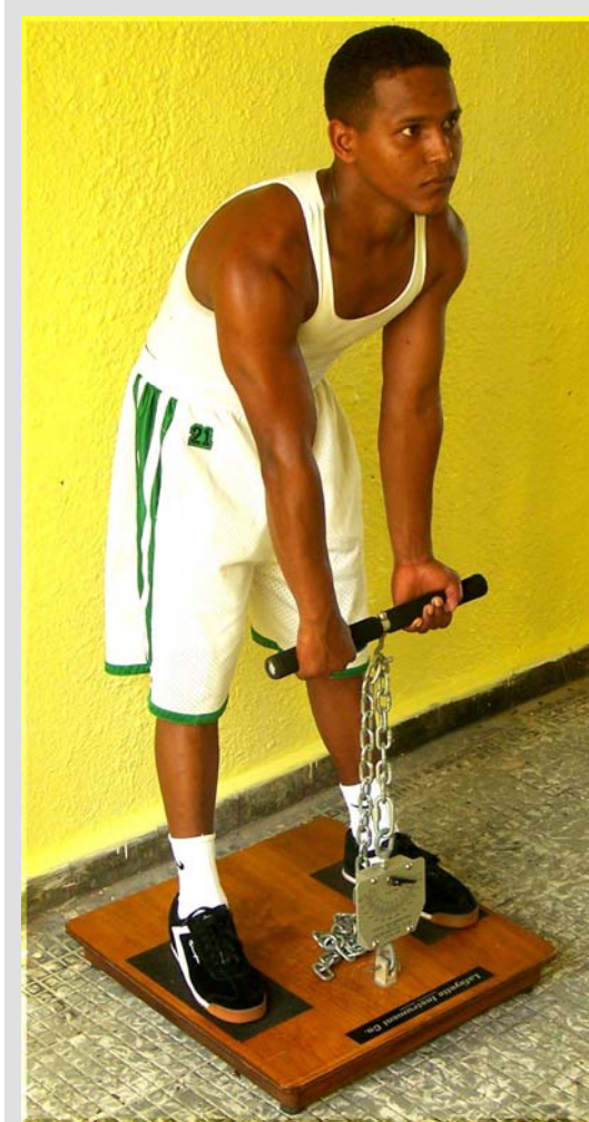
Figura LB-1:1. Posición Correcta para la Prueba de Flexión Troncal. Nótese la posición erecta (pero no trinca) de las piernas y el alineamiento de la cabeza, cuello y tronco. En la esta ilustración de puede observar el grado de inclinación del tronco desde la cintura. Más aún, véase la posición correcta de las manos (al agarrar la barra).